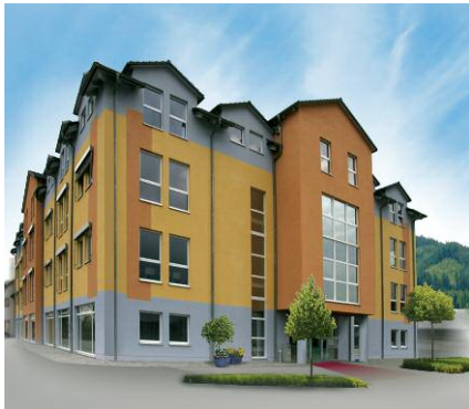
Eindrucksvoll vereint: GSD Softwareentwicklung, Schulungszentrum und stilvolles 4-Sterne Business- und Wellness-Hotel mit mediterranem Restaurant.