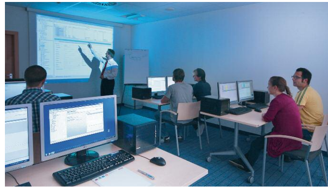
Auf dem neuesten Stand: Für Workshops und Schulungen stehen acht Seminarräume mit modernster Technik bereit.

GSD Software® wurde im Jahr 2014 unter die TOP 100 der innovativsten Mittelständler Deutschlands gewählt und mehrmals mit dem begehrten Innovationspreis der Initiative Mittelstand ausgezeichnet. Durch permanente Weiterentwicklung der Produkte will GSD Software® auch in Zukunft innovative Maßstäbe im Sinne seiner Kunden setzen.